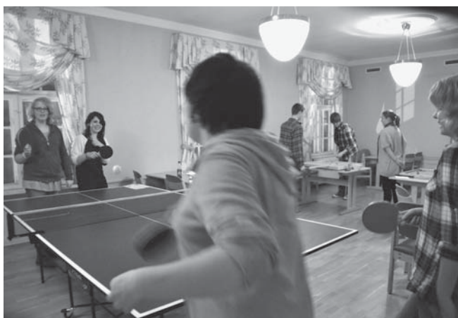
Burgertreff og bordtennis: Ungdom har vært samlet til burgertreff i Generalgården, stikkord er mat, sosialt samvær og aktiviteter.

- De eldre har vaffeltreff, og vi syns burgertreff var pas-