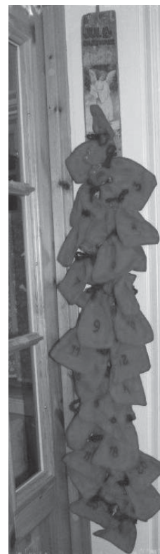
I denne aktivitetskalenderen ligger det en lapp i hver pose.

Tradisjoner skaper som sagt forventninger – en adventskalender får oss til å glede oss til jul, og det er bra å ha noe å se fram til. Tradisjonene du skaper nå, er ting barna dine alltid kommer til å huske å ta med seg når de danner sin egen familie. Husk på at selv om det vi gjør sammen bare varer en liten time, kan det ha stor betydning for de som deltar.