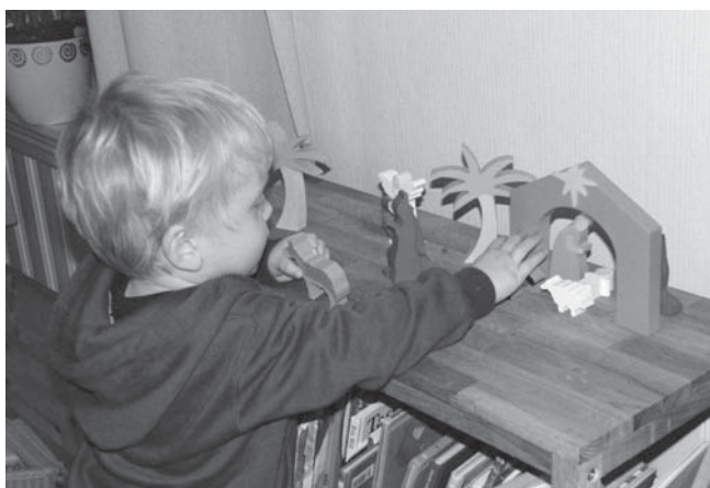
Julekrybba kan gjerne settes frem tidlig i advent.

Mange forbinder gjerne denne årstiden med juleforberedelser som kakebakst, rengjøring og gaveinnkjøp – noe som for mange kan oppleves som ekstra travle dager.