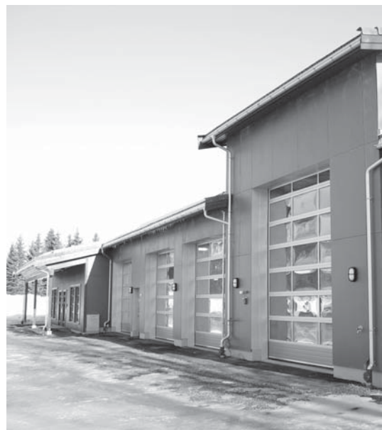
Er dette Norges fineste kirke driftsbygg? Ja, mener de som jobber der.