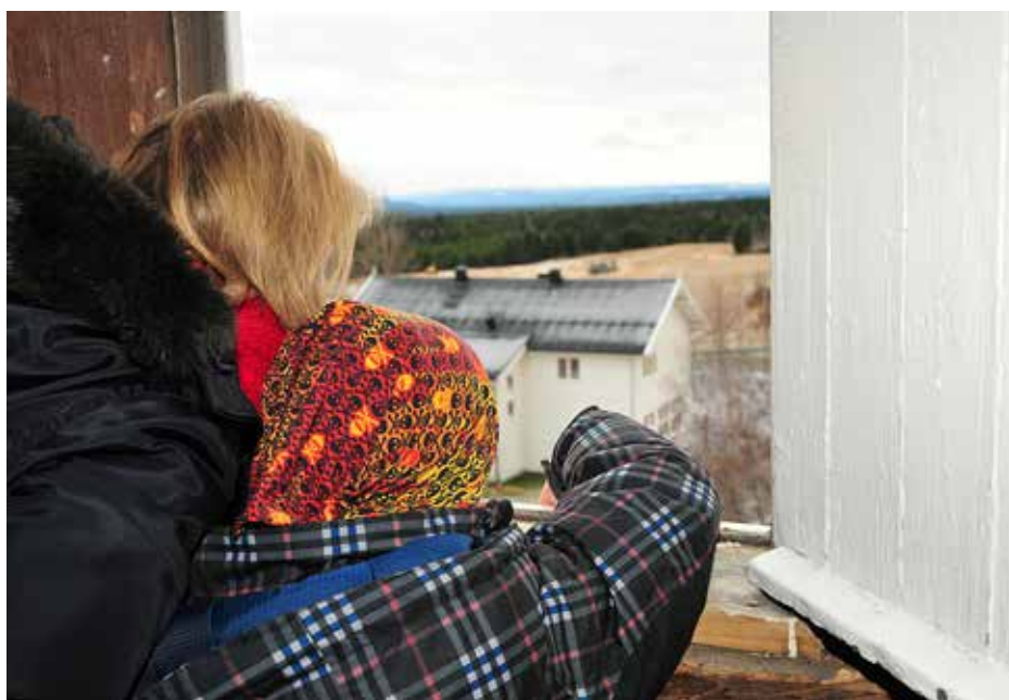
Spennende: Kirkens "kriker og kroker" utforskes når førsteklassingene møtes gjennom fire samlinger i høst.

Se etter invitasjon i posten eller følg med på hjemmesidene våre!